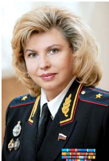
Татьяна МОСКАЛЬКОВА, заместитель председателя Комитета Государственной Думы ФС РФ по делам СНГ, евразийской интеграции и связям с соотечественниками Заслуженный юрист РФ генерал-майор МВД России доктор юридических наук

Взаимоотношения населения с правоохранительными органами в России всегда были чем-то большим, чем просто отношения граждан с одним из институтов власти. Эти отношения оставили особый след в советской и новейшей истории, в отечественных кинематографе и литературе, в социальном опыте каждого из нас.